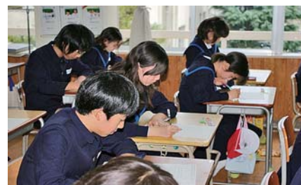
試験風景

京都: 京都・観光文化 長岡京市観光歴史、京野菜 大江山鬼、かめおか・ふるさと 北京都丹後ふるさと、京町家