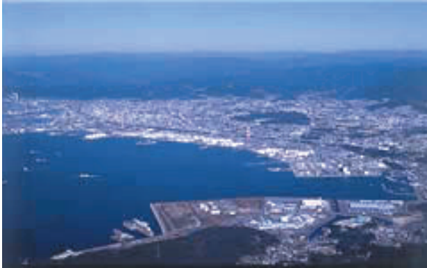
周南コンビナート