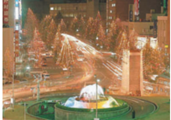
ツリーまつり